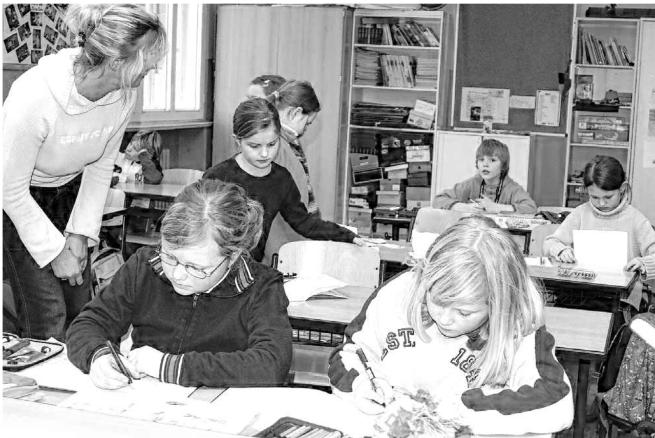
Mehr als zwei Drittel der Lehrkräfte an der Schwyzer Volksschule sind weiblich, rund die Hälfte davon hat ein Arbeitspensum von 50 bis 99 Prozent.

Weniger Schüler, mehr Klassen Die insgesamt 1758 Lehrpersonen an der Volksschule des Kantons Schwyz unterrichten 17 158 Schüler. Diese sind in 987 Klassen eingeteilt, was –